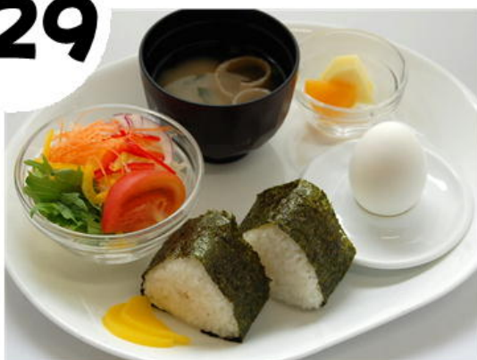
おにぎりモーニング 500円