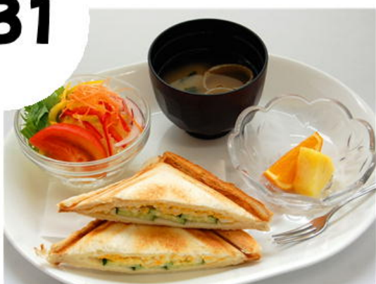
焼きサンドモーニング (たまご) 600円