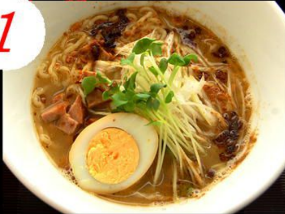
宗田節らーめん 800円