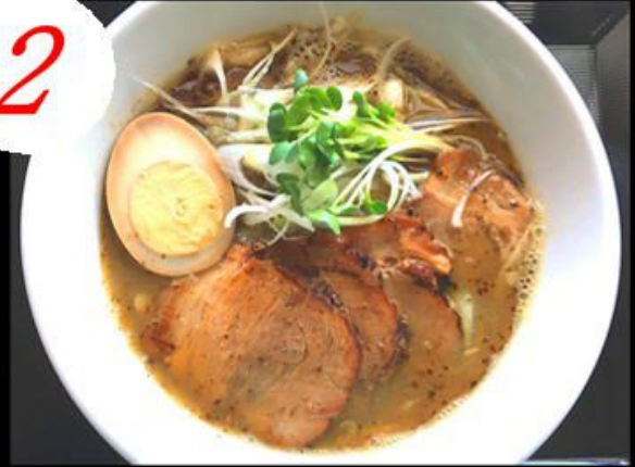
宗田節チャーシュー麺 1,000円